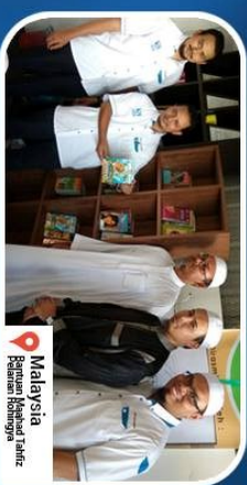
Malaysia Pusat Kesihatan Tahir